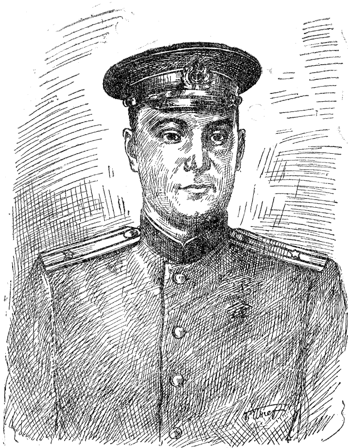
העלד פון סאוועטנפארבאנד צ. ל. קוביקאוו